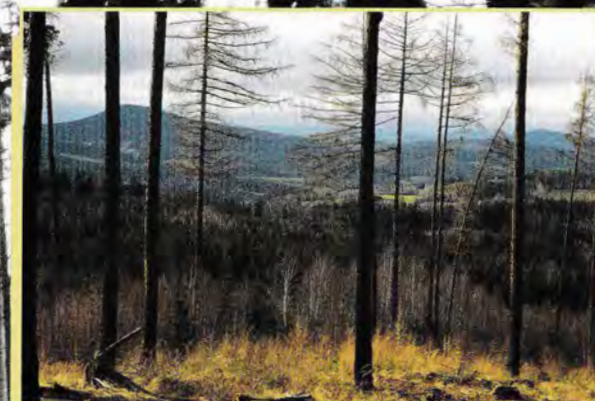
Výhledy ze Soběšického háje