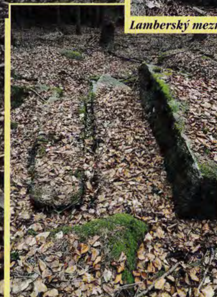
Pozůstatky kamenických prací