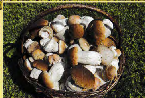
Soběšický háj je houbařským rájem