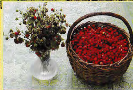
Červená krása v lesích Pošumaví

www.sobesice.cz tel. +420 376 597 325 www.hotelsobesice.cz tel. +420 724 028 664