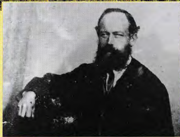
Portrét hajného z atelieru