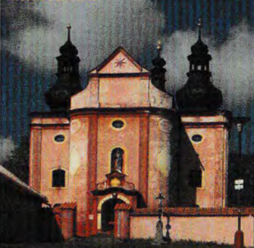
Lovecký zámek v Záluží